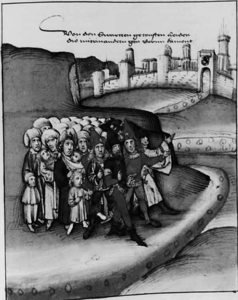
Seite aus der Chronik von Diebold Schilling (1484/85). Schillings Angabe zum Bild: «Von den swartzen getouften Heiden, die miteinander gen Bern kament.»

solten straffen sind selber morder darumb es in der existenz ubel gac. Davu wurden auch etliche herren genant die bi dem herren von Zugum waren namlich Graf Hans von der weiburg der burger zu Bern was der herre von Sant Rooggen und andere die nachmalen mit grossem gut coloset wurden