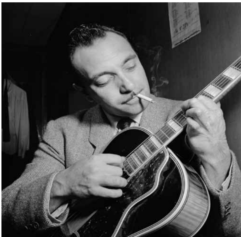
Django Reinhardt (1910–1953).