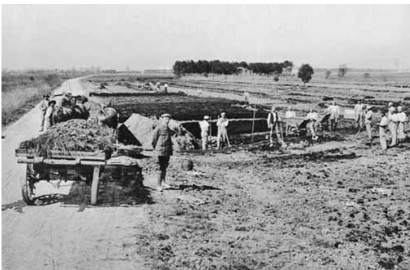
Insassen der Straf- und Internierungsanstalt Witzwil, Kanton Bern beim Torfabbau, um 1915.